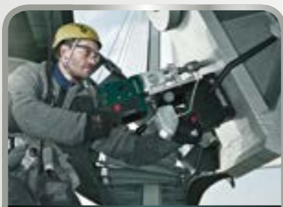
Boren en schroeven

Daarbij concentreren wij ons op de toepassingsgebieden machinebouw, werven, grondstof-/energiewinning tot water (olieplatforms/windparken), raffinaderijen, windenergie, speciale voertuigbouw, pijpleidingbouw en stroomcentrales.