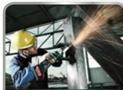
Doorslijpen en afbramen