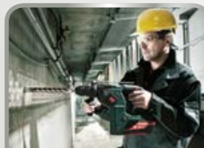
Boren en schroeven

Daarbij staan voor ons de toepassingsgebieden Dak en houtbouw, Vensterbouw, Wand en gevel, Afbouw, Installatie, Vloer en tegels leggen en Tuinbouw en landschapsarchitectuur centraal.