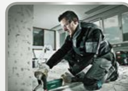
Schuren en doorslijpen