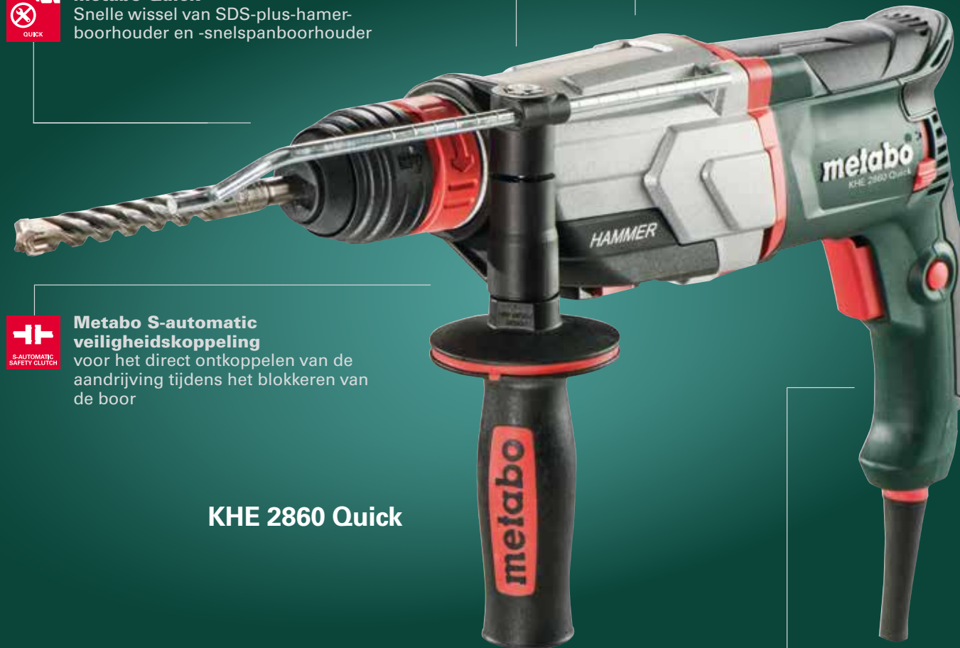
KHE 2860 Quick

voor het direct ontkoppelen van de aandrijving tijdens het blokkeren van de boor